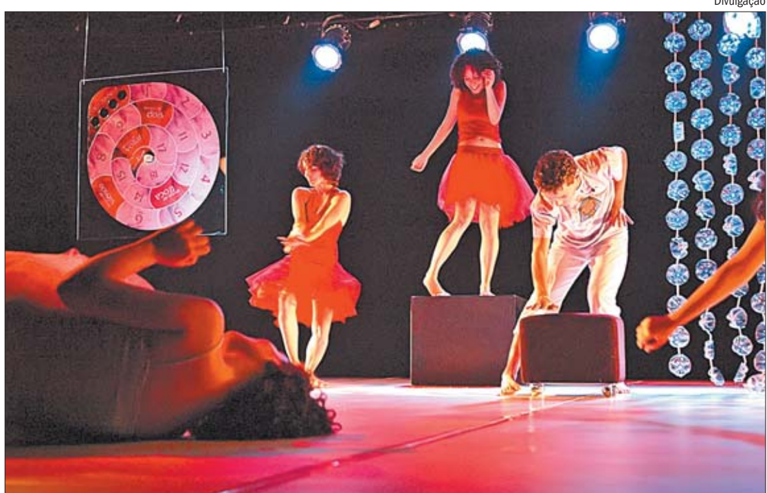
Coletivo Corpomancia foi premiado com o espetáculo "Inocência" e terá um incentivo de R$ 40 mil para a produção